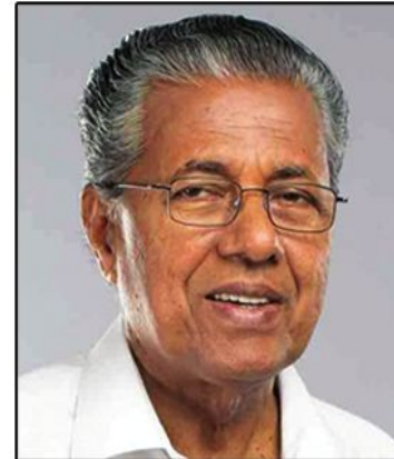
ശ്രീ. പിന്നായി വിജയൻ ബഹു. കേരള മുഖ്യമന്ത്രി